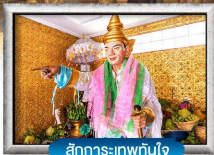
สักการะเทพทันใจ