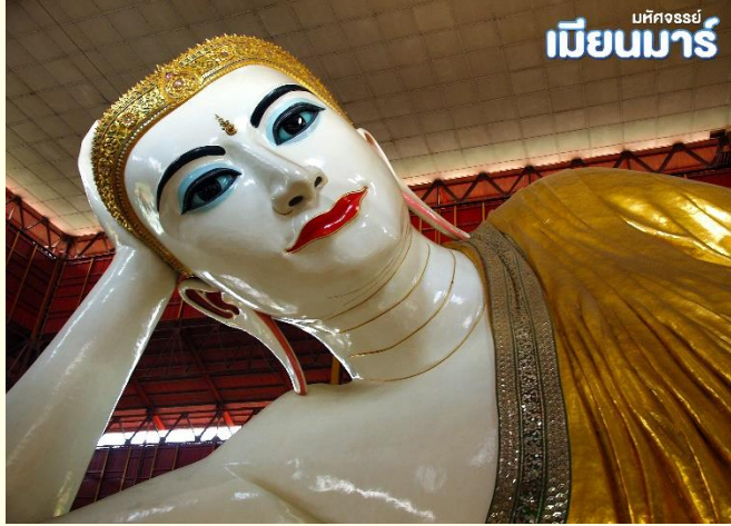
เมืงนมาร