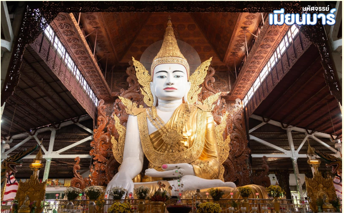
เมืงนมาร

สักการะ พระพุทธรูปองค์ใหญ่ หลวงพ่อกงาทัจฉี (Nga Htat Gyi Pagoda) หลวงพ่อกงที่สูงเท่าตึก 5 ชั้น เป็นพระพุทธรูปปางมารวิชัยที่แกะสลักจากหินอ่อน ทรงเครื่องแบบกษัตริย์ เครื่องทรงเป็นโลหะ ส่วนเครื่องประกอบด้านหลังจะเป็นไม้สักแกะสลักทั้งหมด และสลักเป็นลวดลายต่างๆจำลองแบบมาจากพระพุทธรูปทรงเครื่องสมัยยะตะนะโงะ