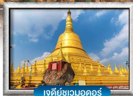
เจดีย์ชเวดมอดอร์