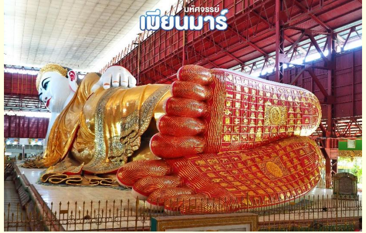
เมืงนมาร